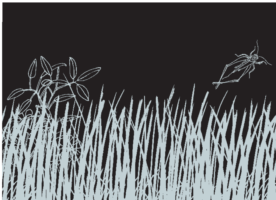
ILUSTRAÇÃO Rosana Faria